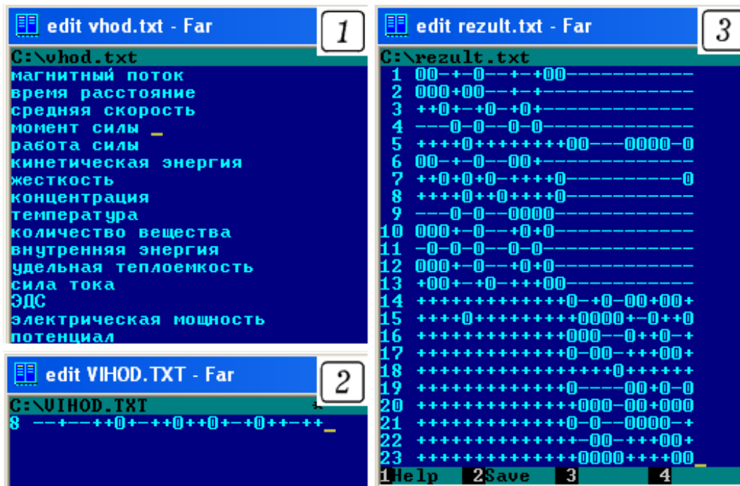
Рис. 2. Список оцениваемых понятий (файл vnod.txt), результаты сравнений понятия 8 с другими понятиями (файл vnod.txt) и получающаяся матрица оценок.