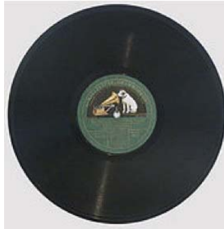
ემილ ბერლინერის გარამოფონი და შელაკის ფიფიტა

ჩაწერის ვალდემარ პულსენისეული მაგნიტური ტექნოლოგია კი, განვითარების გრძელი გზა რომ განვლო და ბოლოს, 1935 წელს გერმანულ კომპანია AEG-ს პატენტირებული მაგნეტოფონით დასრულდა, აღმოჩნდა ის ყველაზე მოხერხებული საშუალება, მაგნიტოფირი კი ყველაზე ხარისხიანი მედიუმი (როგორც კომერციულ, ისე შემოქმედებით მუსიკაში), რომელიც ანალოგურ ხანაში XX საუკუნის 90-იან წლებამდე ბატონობდა, ვიდრე ციფრული ტექნოლოგია მომძლავრდებოდა და თავისი რევოლუციური შესაძლებლობებით თითქმის მთლიანად განდევნიდა ანალოგურ მედიუმს ხმარებიდან.