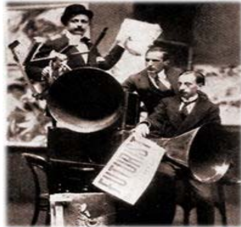
რუსოლო, მარინეტი და პიატი

1914 წელს კი მილანის ტეატრო დალ ვერმეში გაიმართა ინტონარუმორის ორკესტრის (23 ინსტრუმენტი) პირველი საჯარო კონცერტი, რომელსაც საშინელი სტვენა, ხმაური და, ბოლოს, ხელჩართული ბრძოლა მოჰყვა ფუტურისტებსა და მათ მოწინააღმდეგეებს შორის. რუსოლომ, ამაყად რომ იხსენებს თავისი ფუტურისტი მეგობრების (მარინეტის, ბიჩონეს, მაცას, პიატის) ვაჟკაცურ მუშტიკრივს 1916 წელს გამოცემულ კრებულში, 13 შეუპოვრად განაგრძო თავისი ორკესტრის პოპულარიზაცია როგორც საკონცერტო დარბაზებში, ისე პრესაში, სადაც, სხვათა შორის, ინტონარუმორის „ენჰარმონიული ნოტაცია“ („Grafia enarmonica“) წარმოადგინა.