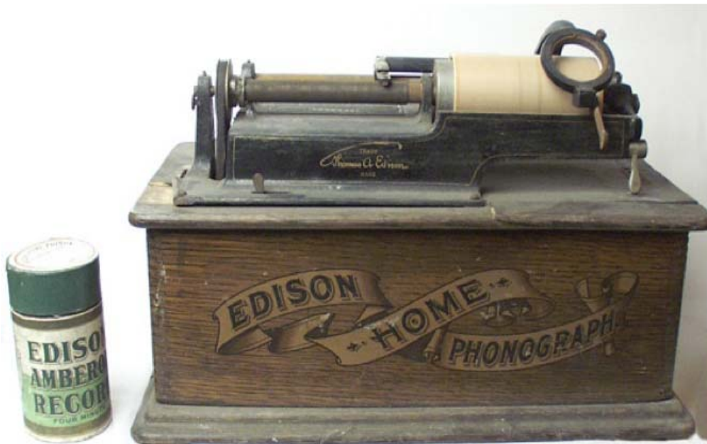
თომას ედისონის ფონოგრაფი