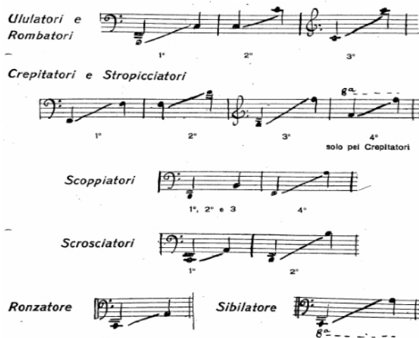
ინტონარუმორის ინსტრუმენტები დიაპაზონის მითითებით

1913 წელსვე მოდენაში, ტეატრო სტორკიში, რუსოლომ საზოგადოებას წარუდგინა ერთ-ერთი ასეთი ინსტრუმენტი, სახელად „scoppiatore“, რომელსაც მაშინდელი მოტორის მსგავსი ხმა და ორი ოქტავის დიაპაზონი ჰქონდა.