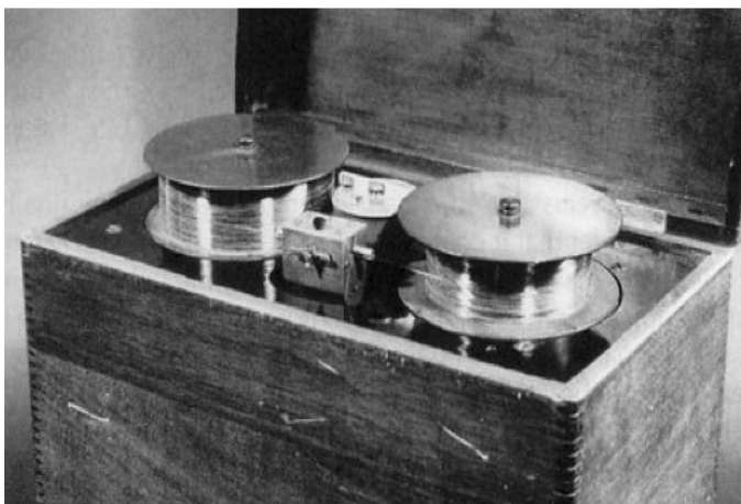
ვალდემარ პულსენის ტელეგრაფონი სპილენძის მავთულით

ჩაწერის ვალდემარ პულსენისეული მაგნიტური ტექნოლოგია კი, განვითარების გრძელი გზა რომ განვლო და ბოლოს, 1935 წელს გერმანულ კომპანია AEG-ს პატენტირებული მაგნეტოფონით დასრულდა, აღმოჩნდა ის ყველაზე მოხერხებული საშუალება, მაგნიტოფირი კი ყველაზე ხარისხიანი მედიუმი (როგორც კომერციულ, ისე შემოქმედებით მუსიკაში), რომელიც ანალოგურ ხანაში XX საუკუნის 90-იან წლებამდე ბატონობდა, ვიდრე ციფრული ტექნოლოგია მომძლავრდებოდა და თავისი რევოლუციური შესაძლებლობებით თითქმის მთლიანად განდევნიდა ანალოგურ მედიუმს ხმარებიდან.