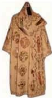
სურ. 1. მღვდლის შესამოსელი