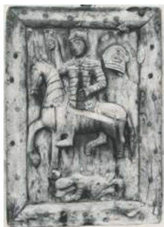
Рис. 19. Первоэлементы древнегрузинской резьбы по дереву, которыми вдохновлялся. Мастер Шгхи. Часть барельефного декора и рельефного орнамента из Лашес-Вани (Имеретия), выполненная в наивном стиле (ныне – в коллекции Кутаисского государственного исторического музея имени Нико Бердзенишвили).

Рис. 20. Двери из Саване с орнаментальным фризом из аканта, уложенного в волнообразный круглый меандр (Имеретия).