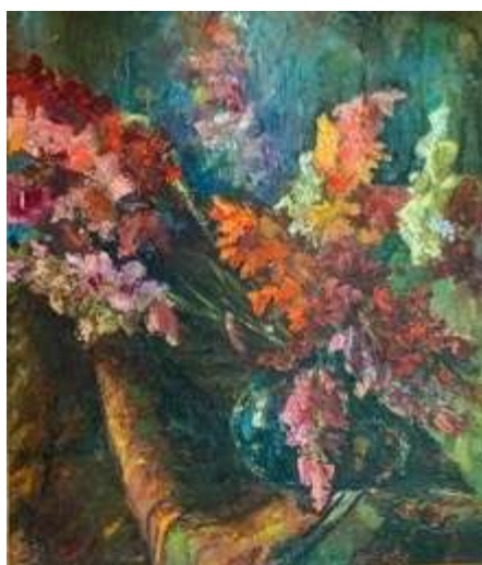
Рис. 2. Вепхвадзе Рубен Павлович. Гладиолусы. Холст, масло. Вторая половина 1980-х гг. Частная коллекция.