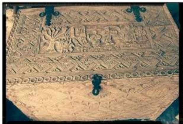
Рис. 12. В. Вепхвадзе. Сундук (ковчег) для муки. Около 1 метра в ширину и 70 см в высоту. Мотивы круглой резьбы по центру апеллируют к декоративным решениям с Лашез-Вани и Ананури, розет – к Ркони, ромбические мотивы орнамента близки к прообразам из Чажаша. Ольха. 1999 г. На переднем фасаде справа в рондальном резерве расположена авторская монограмма В. Вепхвадзе – две буквы «в» по-грузински.