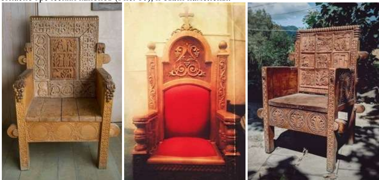
Рис. 4. В. Вепхвадзе. Трон для выставки в Тбилиси. 1988 г. Тбилиси, частная коллекция. Дуб, грецкий орех. Апелляция к древним мотивам Лашес-Вани. Украшен на спинке

В течении последующей тридцатилетней творческой деятельности, он выполнил входные двери и алтарные входы для ансамблей около десяти монастырей (в общей сложности около 50-ти), и более 20-ти тронов (Рис. 6), политронов и савардзели. С 1995 г. эти заказы уже имели системный характер. В основном он получал на них благословение из митрополий, поскольку стал уже признанным мастером, работы которого выполнялись с молитвой, очень тонко, апеллируя к византийско-грузинскому наследию (Рис. 7, 8, 9, 11) согласно греческих канонов (Рис. 10), и были намолены.