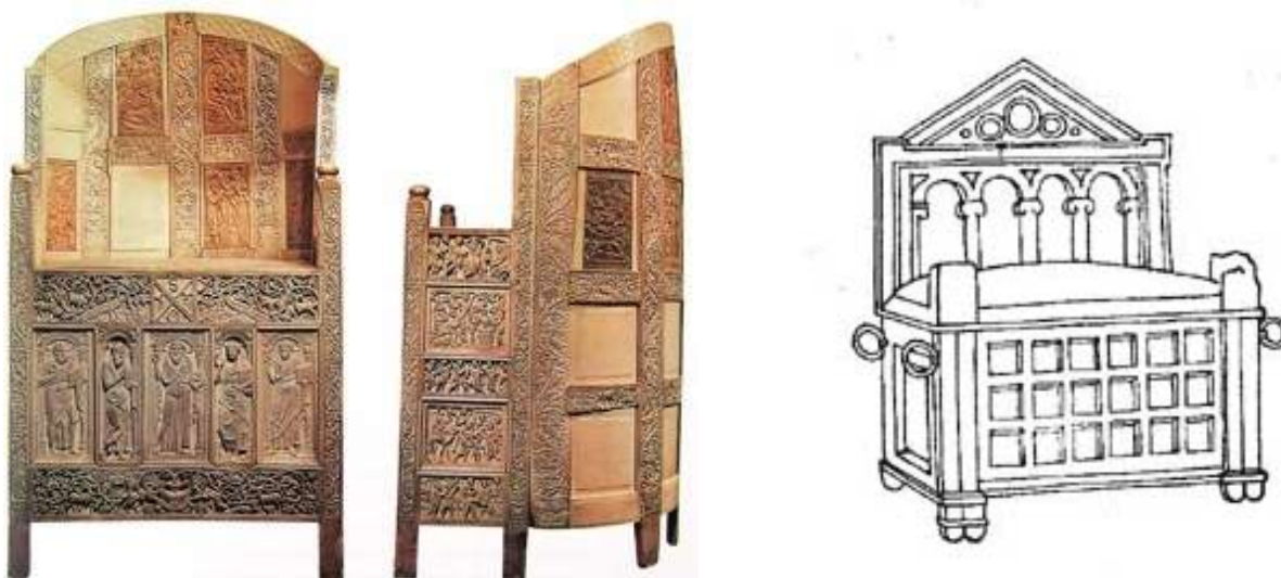
Рис. 7. Трон Максимилиана. Византия. VI ст.

Рис. 6. В. Вепхвадзе. Трон. Ликани. Боржомский р-н. Мотивы нижних розет восходят к прообразам резьбы в Мелеси. 1989 г. Бук. Солярные знаки в этом ансамбле дополняют пальметы по типу египетских, персидских, греческих, которые представляют собой веерообразный стилизованный цветок лотоса – символов божественной красоты, духовной чистоты, человеческой мудрости и блаженства.