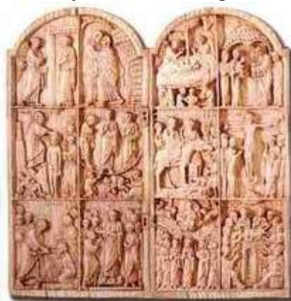
Рис. 9. Деревянный складень X столетия. Византия.